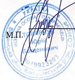
Токарчук Ю. Б.

Фізична особа – підприємець Токарчук Юрій Богданович Волинська обл., Луцька ОТГ, с. Озерце, вул. 9- го Травня, 24 р/р UA05325365000002600501426224 ПАТ «КРЕДОБАНК» МФО 325365 ППН 3079923293 Єдина система оподаткування, III група