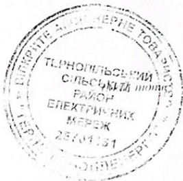
Куций І.В. П.І.Б.)