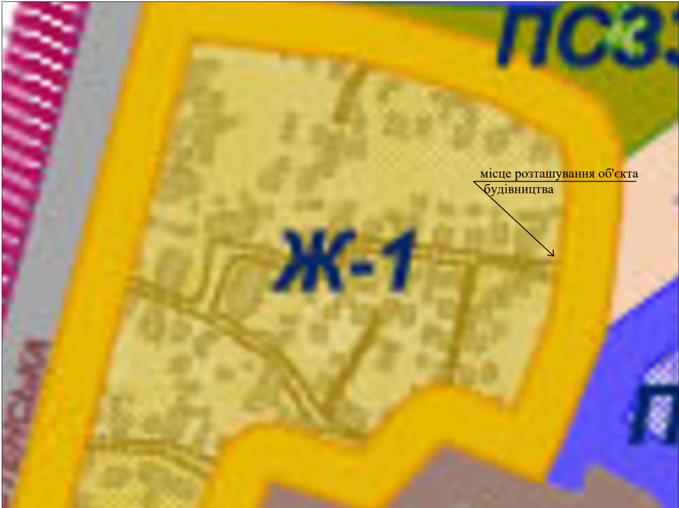
ВИТЯГ З ПЛАНУ ЗОНУВАННЯ