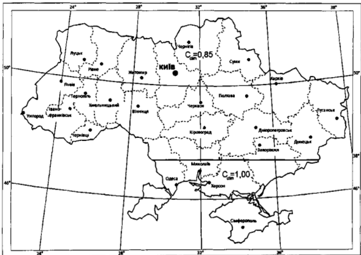
Рисунок 1 – Значення величин C_{clim}

7.2.2 Кількість дощових вод, що скидаються від розподільної камери q_{sc} , л/с, визначається за формулою: