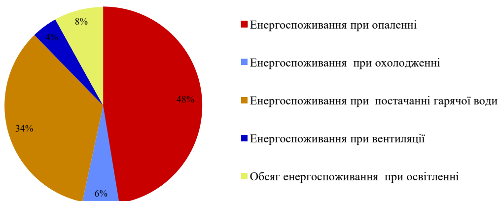
Діаграма річного енергоспоживання будівлі

Причини відхилення обсягів споживання визначених за результатами сертифікації від обсягів споживання визначених за показами відповідних приладів обліку